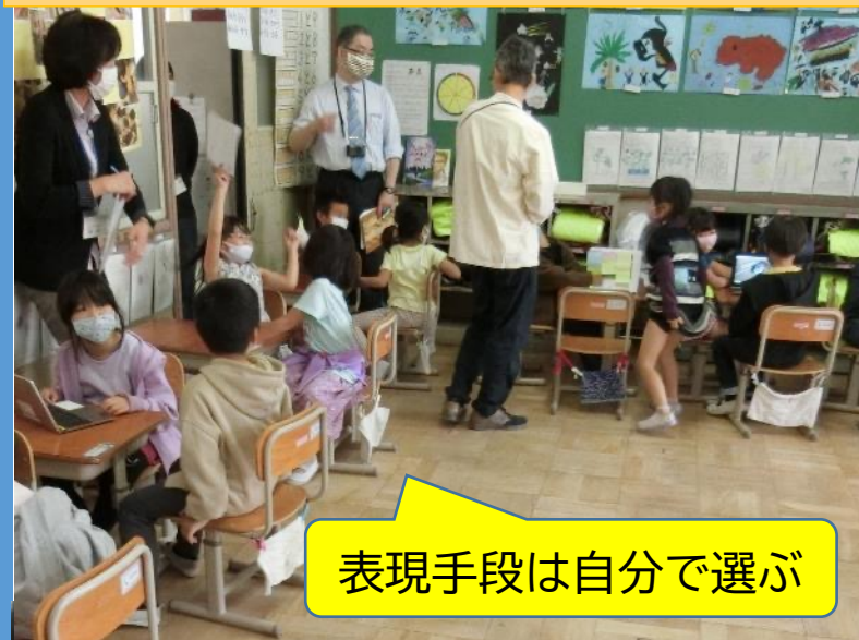
表現手段は自分で選ぶ