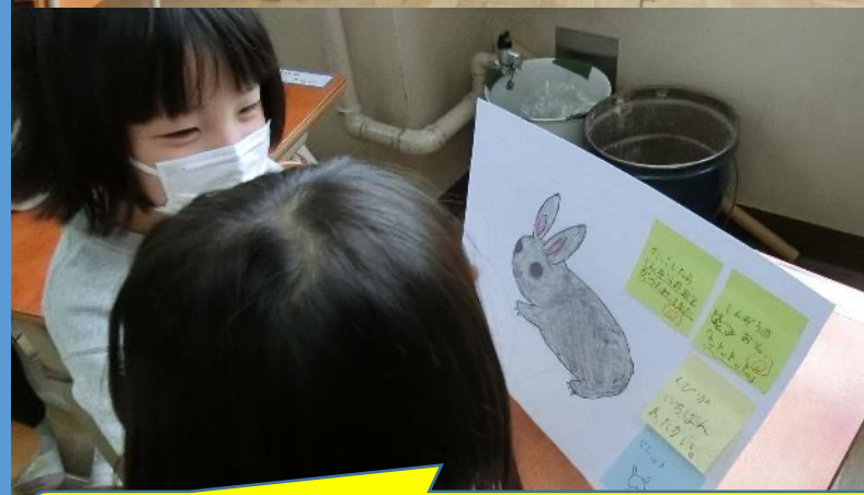
書きためた情報から発表用に資料に再構成