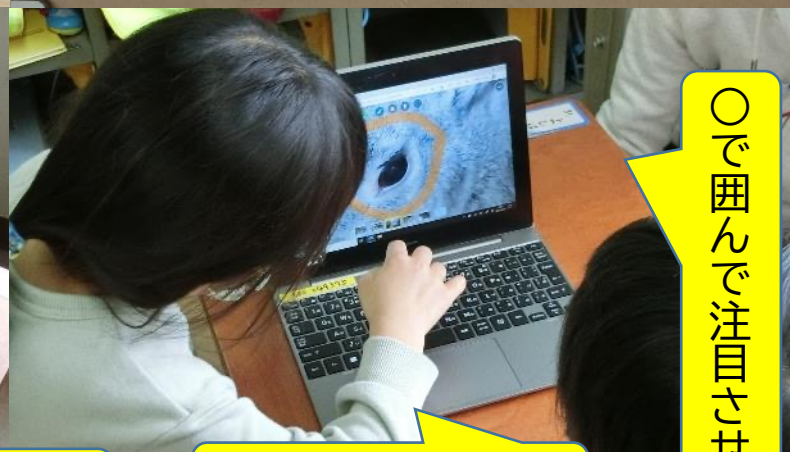
写真や動画も活用